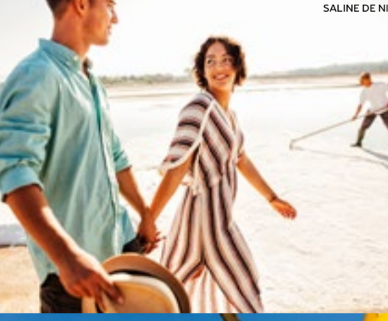
SALINE DE NIN