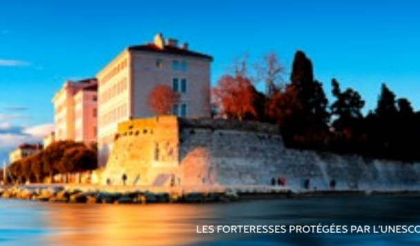
LES FORTERESSES PROTÉGÉES PAR L'UNESCO