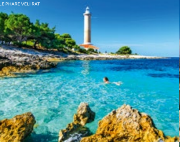
LE PHARE VELI RAT

Resentez l'appelle de la mer Adriatique et de sa brise, amarez votre bateau dans des ports accueillants et des marines écologiques, découvrez la beauté épatante des parcs naturels et nagez dans les eaux turquoise des criques tranquilles.