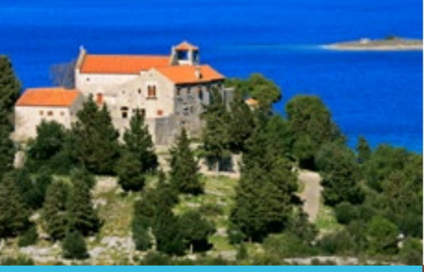
LE MONASTÈRE ĐOKOVAC

27 L'ESCALADE AU PARC NATIONAL DE PAKLENICA Plus de 150 km d'excellentes pistes de montagne et deux sommets de plus de 1750 m fond du PN de Paklenica un véritable paradis pour chaque alpiniste randonneur!