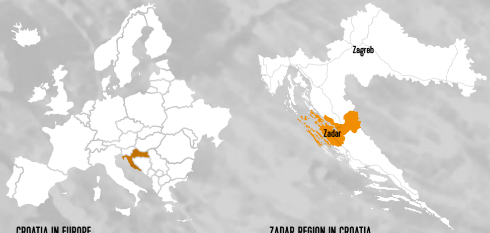
CROATIA IN EUROPE