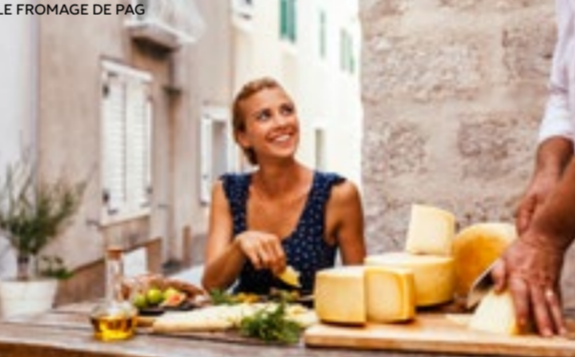
LE FROMAGE DE PAG

35 LE PARC NATUREL DE TELAŠĆICA Choisissez votre lieu favori parmi entre 25 petites plages, une falaise de 161 m de haut, un lac d'eau salée, des îles pittoresques et insolites et des miradors époustouflants!