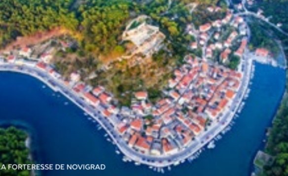
LA FORTRESSE DE NOVIGRAD

37 LES FALAISES - la célèbre « stena » de l'île Dugi otok, dont la hauteur atteint 161 m et la profondeur 85 m.