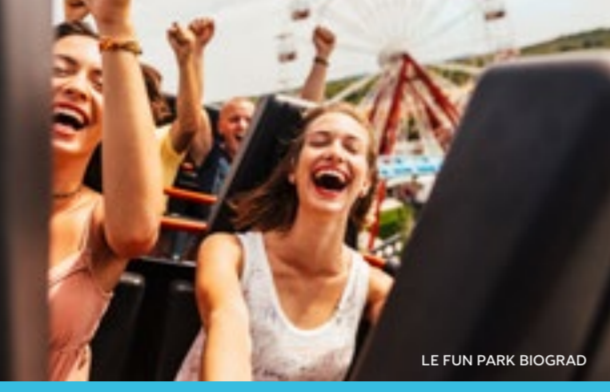
LE FUN PARK BIOGRAD

Zadar est la ville du romantisme et de l'amour, lieu de passion et d'esprit ! C'est une ville qui n'hésite pas à explorer de nouvelles formes d'art et de nouvelles idées afin d'enrichir sa position déjà excellente, ses attractions et sa structure magnifique.