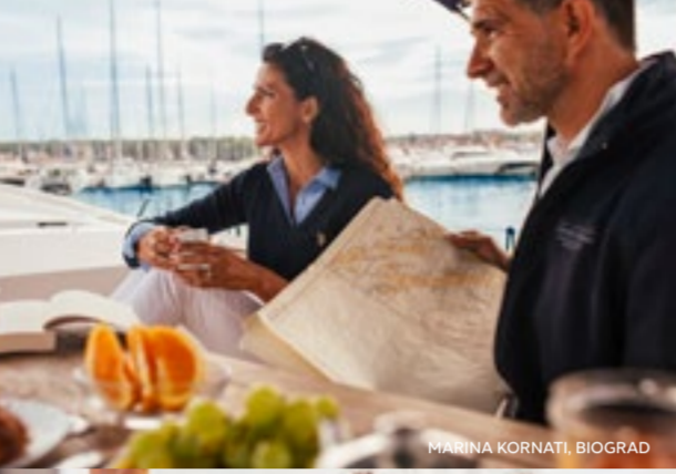
MARINA KORNATI BIOGRAD