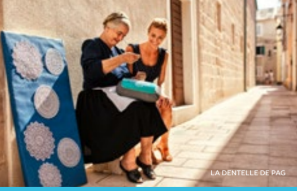
LA DENTELLE DE PAG

11 L'ÉGLISE SAINTE-CROIX - ou « la plus petite cathédrale du monde », sert d'horloge solaire, donnant la date exacte des équinoxes et des solstices.