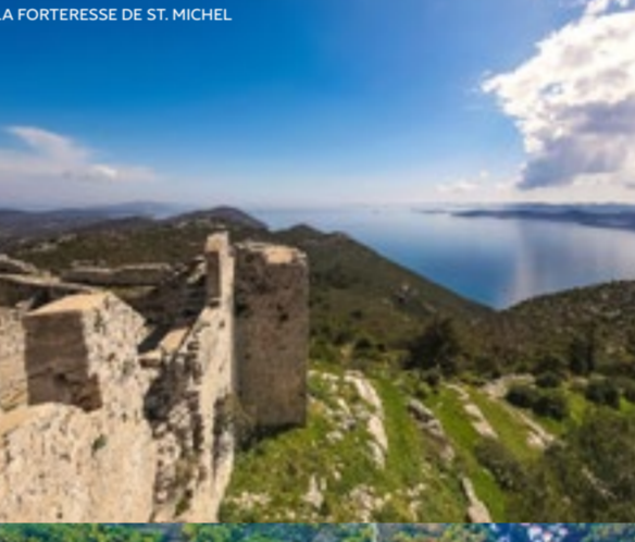
LA FORTRESSE DE ST. MICHEL