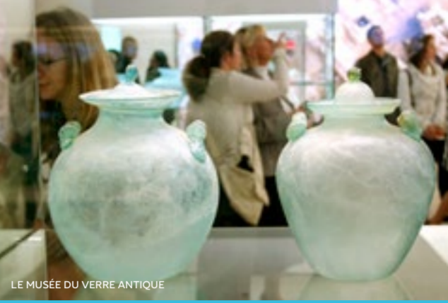
LE MUSÉE DU VERRE ANTIQUE