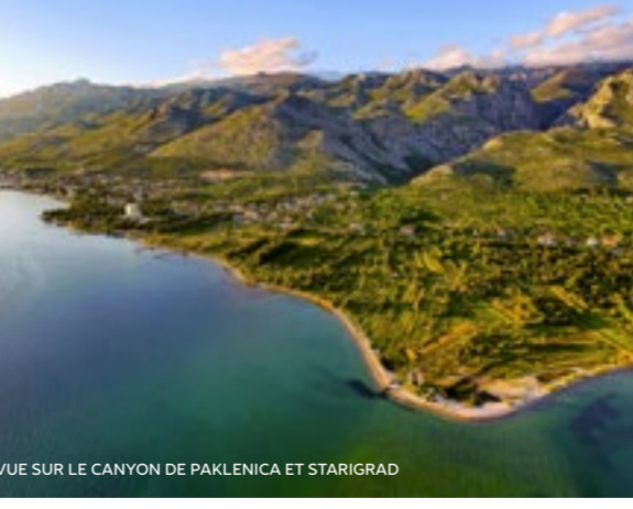
VUE SUR LE CANYON DE PAKLENICA ET STARIGRAD

Visitez la contrée des légendes impressionnantes et des aventures excitantes, des plages de sable et de gravier, des centaines d'espèces végétales et animales inscrites au patrimoine UNESCO et présentes dans les films de Winnetou. Laissez-vous enchanter par les montagnes et la mer, vous verrez que cette région est idéale pour un tourisme actif et d'aventure.