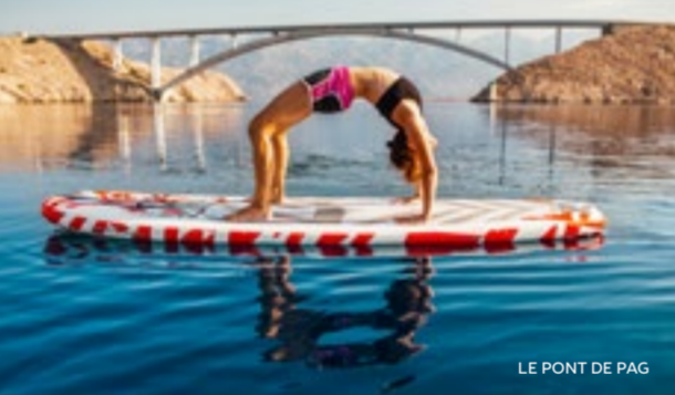
LE PONT DE PAG