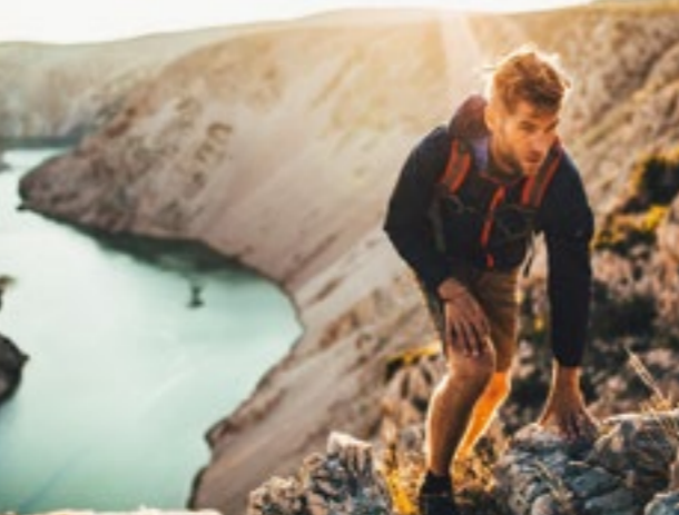
LE CANYON DE ZRMANJA

14 LES PLAGES DE LA RIVIERA DE NIN Ninska rivijera Les belles criques de sable Bilotinjak, Zdrilac et Kraljičina plaža s'inscrivent parmi les plus belles plages en Croatie.